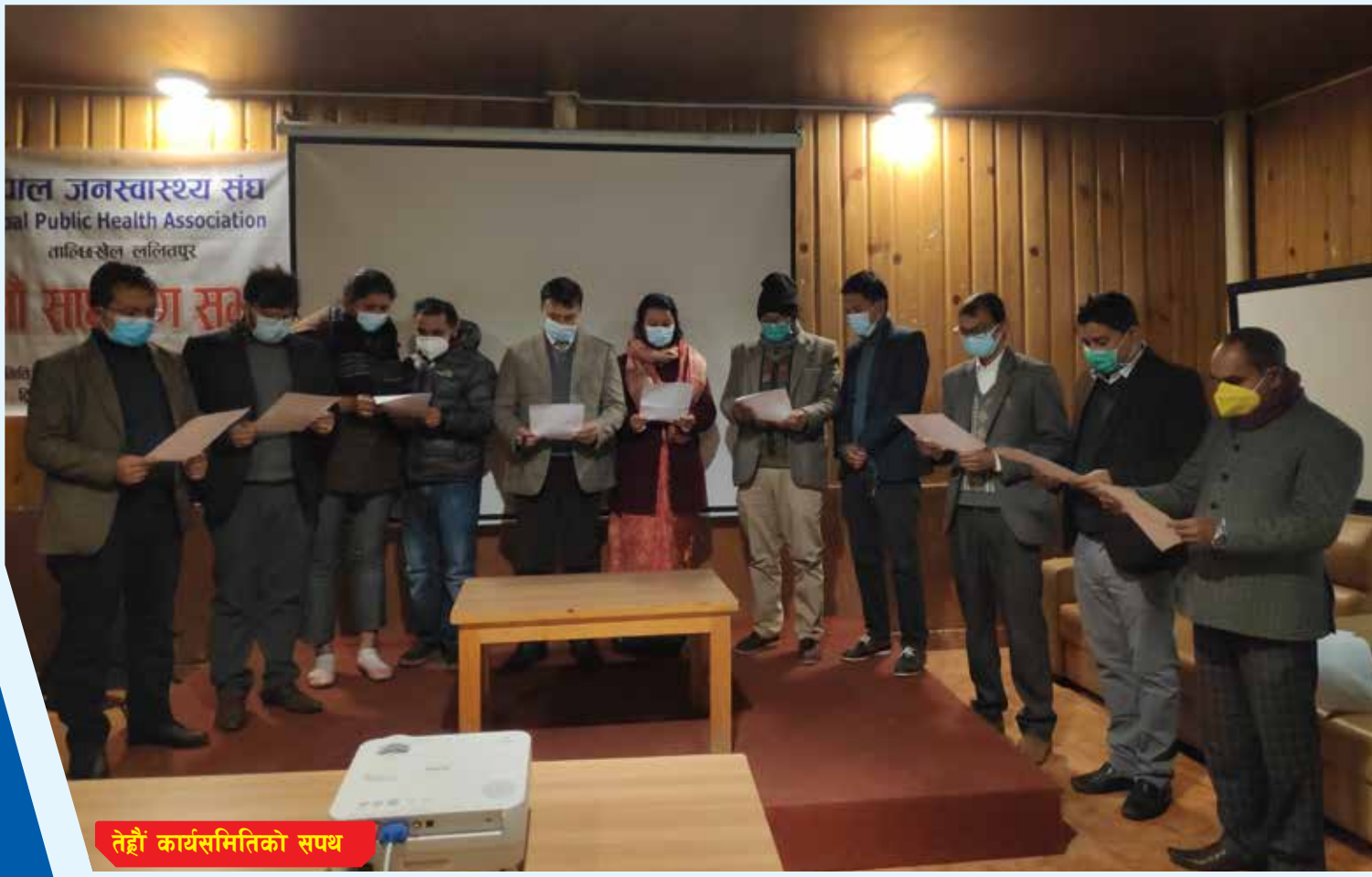
तेह्रौं कार्यसमितिको सपथ