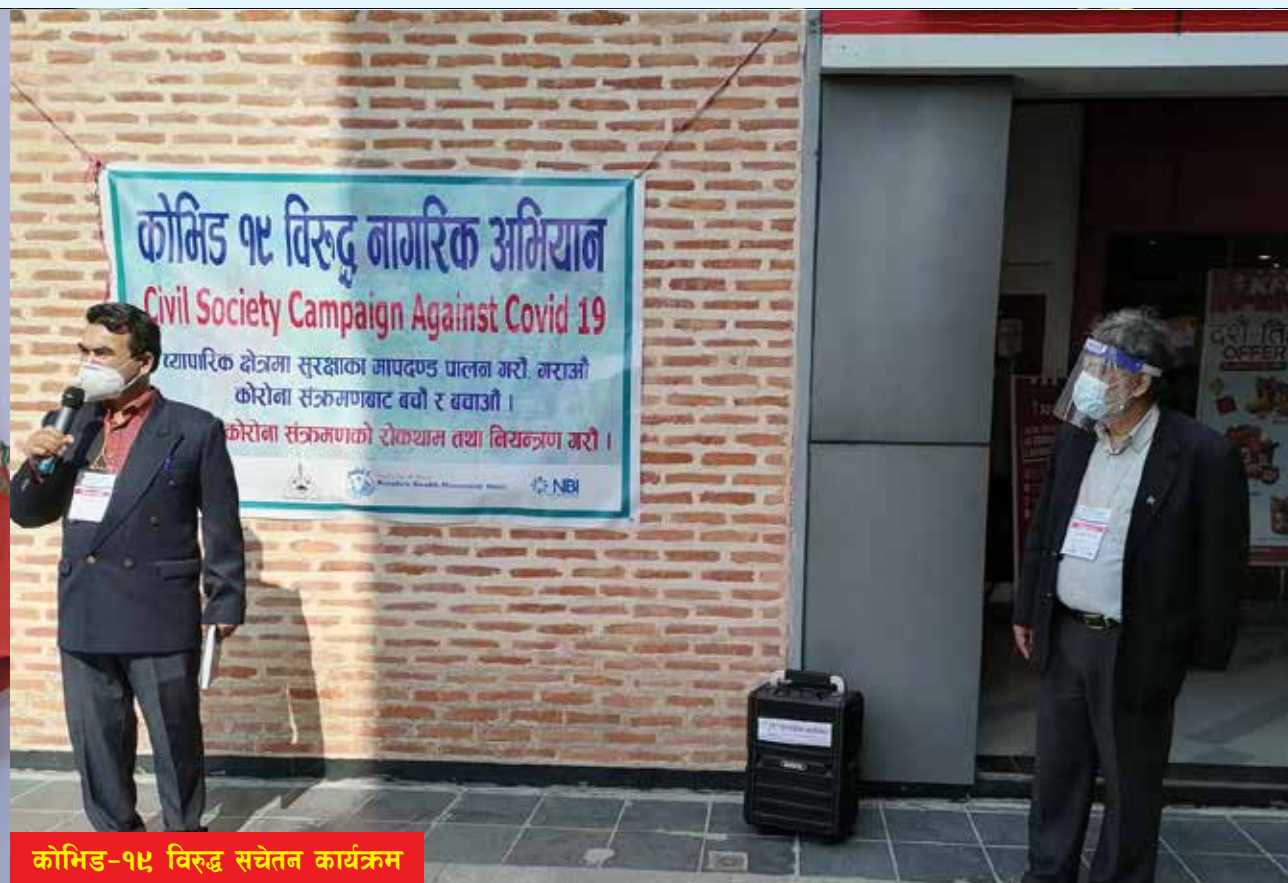
कोभिड-१९ विरुद्ध सचेतन कार्यक्रम