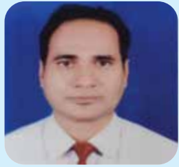
किशोर अधिकारी बागमती प्रदेश