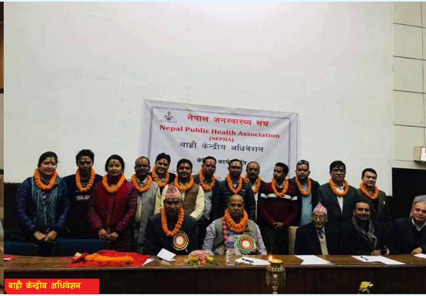
बाह्रौं केन्द्रीय अधिवेशन