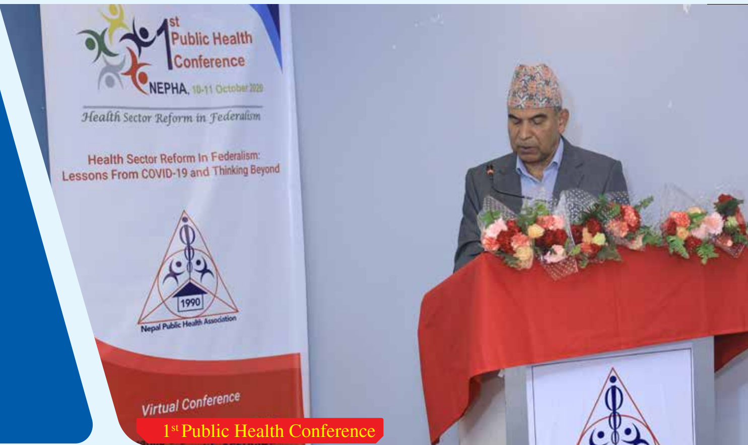
1st Public Health Conference